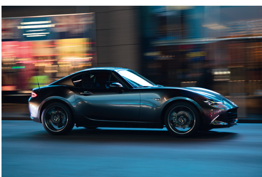
Mazda MX-5 RF 2.0L Sélection avec option peinture Métallisée Machine Gray.