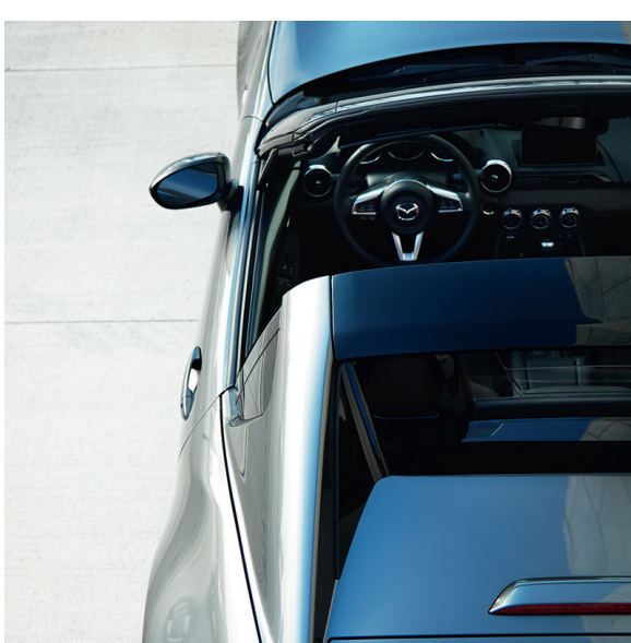
Mazda MX-5 RF 2.0L Sélection BVA avec option peinture Métallisée Machine Gray.